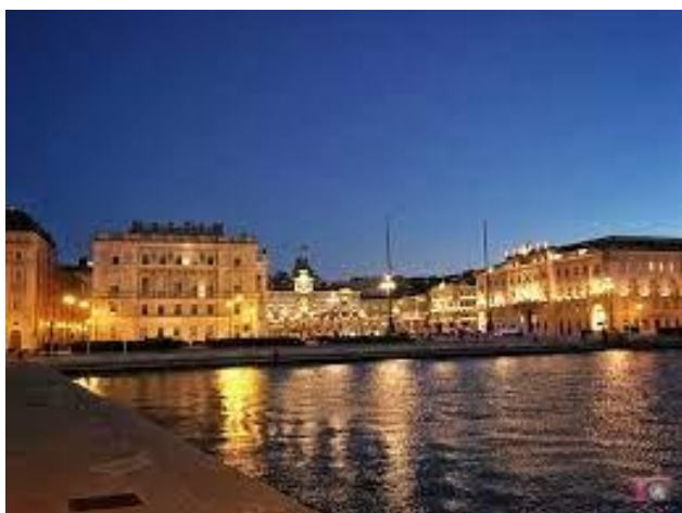
Pogled na Trst z Molo Audace